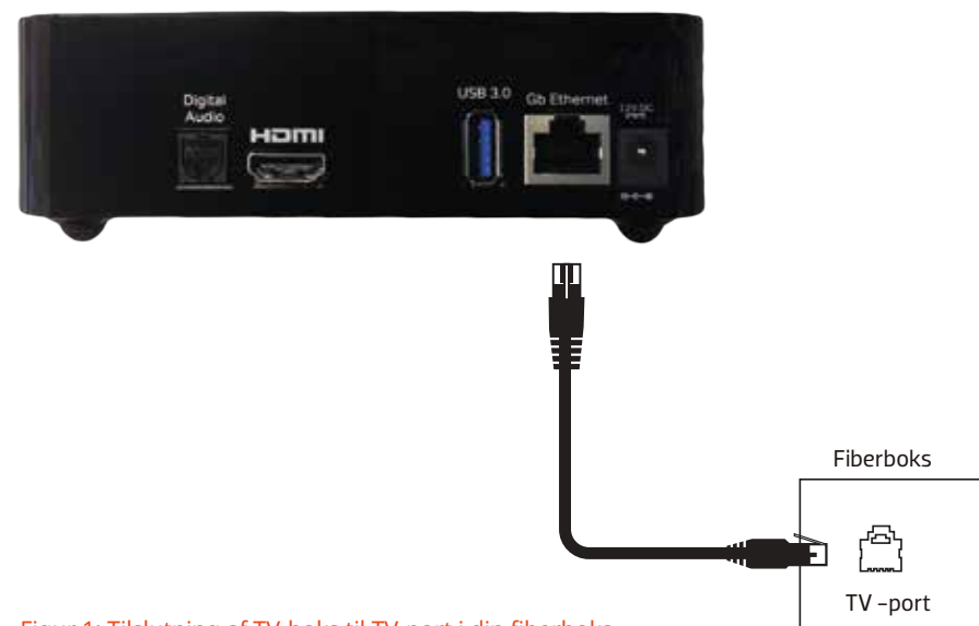
Figur 1: Tilslutning af TV-boks til TV-port i din fiberboks.

Se i din vejledning til fiberboksen hvilke porte, der er TV-porte.