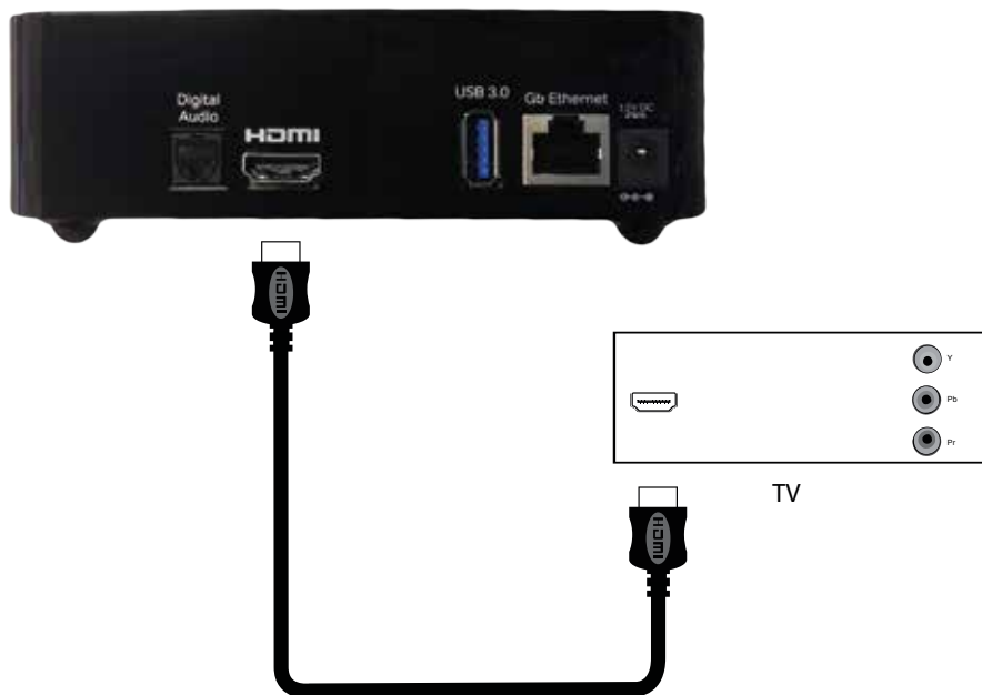
Figur 2: Tilslutning med HDMI-kabel.

Sæt HDMI-kablet i en HDMI-indgang bag på dit TV og forbind den anden ende til HDMI-porten bag på TV-boksen (figur 2).