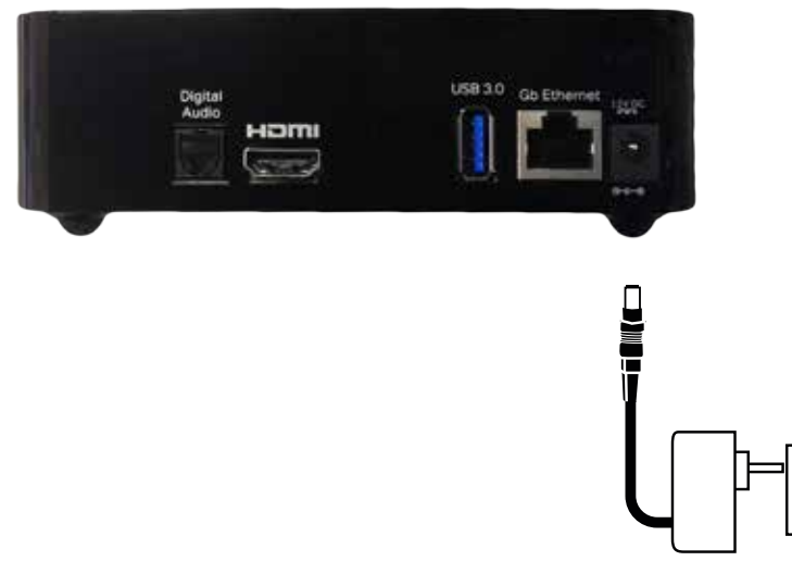
Figur 3: Forbindelse til strømudtag.

Forbind strømforsyningen med TV-boksen (indgangen mærket "12V DC"). Sæt herefter strømforsyningen i en stikkontakt (figur 3).