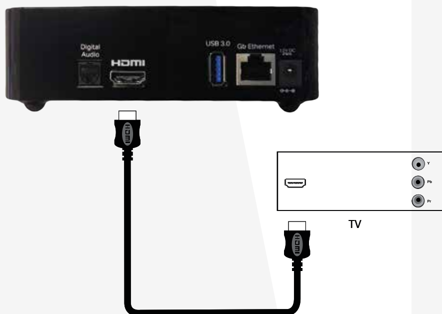
Figur 2: Tilslutning med HDMI-kabel.

Sæt HDMI-kablet i en HDMI-indgang bag på dit TV og forbind den anden ende til HDMI-porten bag på TV-boksen (figur 2).