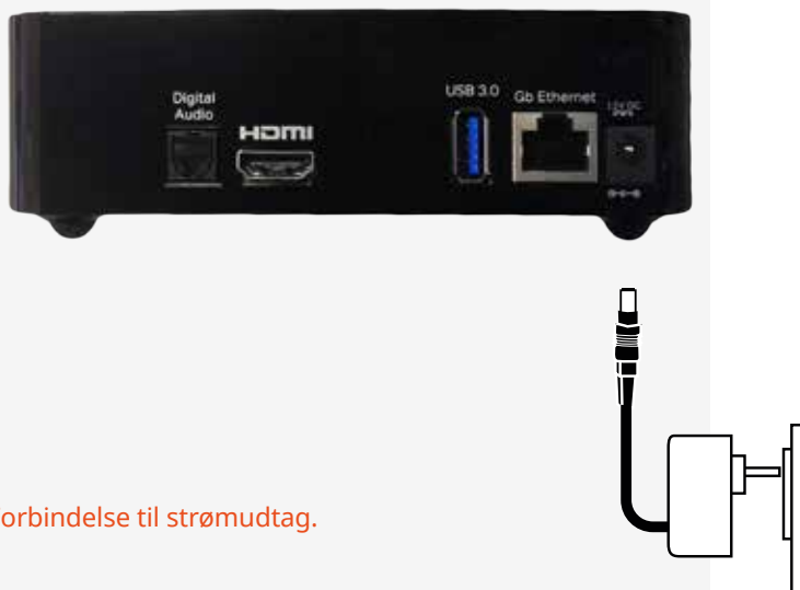
Figur 4: Forbindelse til strømudtag.

Forbind strømforsyningen med TV-boksen (indgangen mærket "12V DC"). Sæt herefter strømforsyningen i en stikkontakt (figur 4).