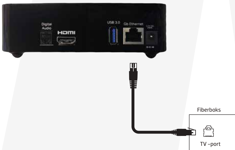
Figur 1: Tilslutning af TV-boks til TV-port i din fiberboks.

Se din vejledning til fiberboksen hvilke porte, der er TV-porte.